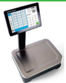
Bi Quelle mettler Toledo

Smarter Wägen mit Touch-Komfort Schnell und Intuitiv im Bedienservice Einfach. Robust. Funktionsstark.