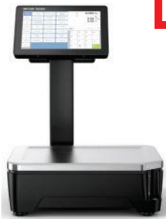
Wägebereich 6/15kg Teilung 2/5g