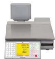
RU C2 Kompaktwaage