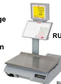
RU U2 Waage