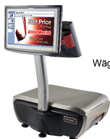
Wägebereich 6/15kg Teilung 2/5g